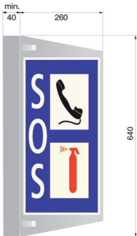
Paroi de tunnel droite